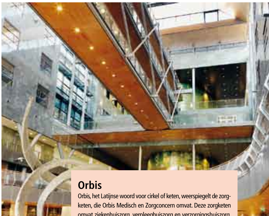
Het 'tropische' Atrium: met tropische houtsoorten, heldere kleuren en bamboe mozaïek.

De buitenkant heeft twee kleuren: het lichtgroene van het natuursteen graniet en het rood van bakstenen. Al vanaf het prille begin stonden deze contrasterende kleuren vast in het ontwerp. In 2001 was er nog sprake van lichtgroene zonnepanelen. Van der Leij betreurt dat het idee van de lichtgroene zonnepanelen niet doorging door de eis van de leverancier, dat hij ook het exclusieve contract wilde hebben voor gehele energievoorziening in het toekomstige ziekenhuis. Die koppeling wilde Orbis hem niet garanderen. Dat betekende de exit van deze innovatieve ecologische energievoorziening - iets dat anno 2009 enige verwondering wekt - en er werd voor lichtgroen graniet gekozen. Het graniet waarvan de leverancier in het bestek werd genoemd, is in China gedolven en bijna honderd euro per vierkante meter goedkoper dan bijvoorbeeld graniet uit Zwitserland of Italië.