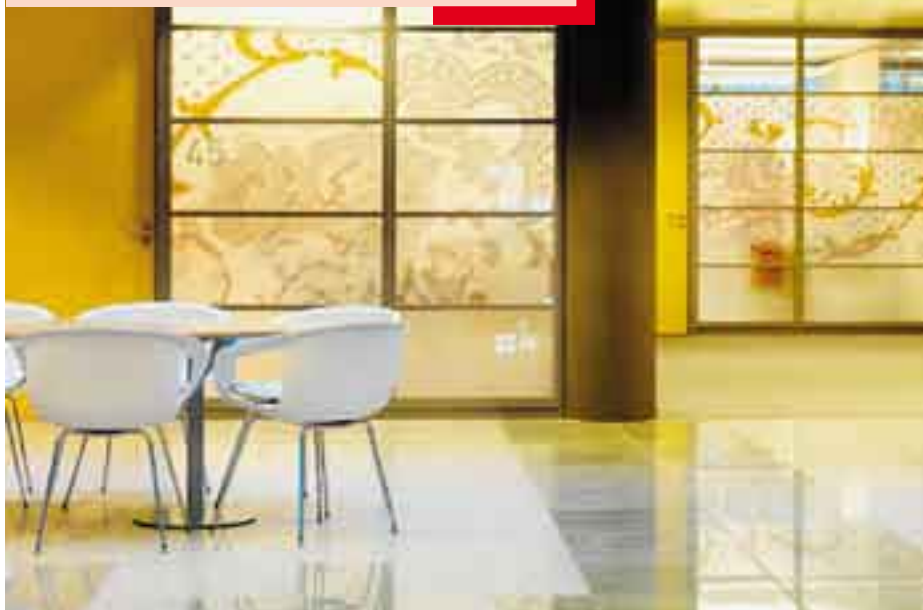
Het wachtgebied met zicht op de spreekkamers: subtropisch klimaat, Midden-Oosters.

als ook de aan- en afvoer van koude en warme lucht naar de onderaardse opslag in putten elders op het terrein. Dit ecologische warme en koude luchtsysteem voorziet het ziekenhuiscomplex zomers van koude lucht en 's winters van warme lucht. ┘