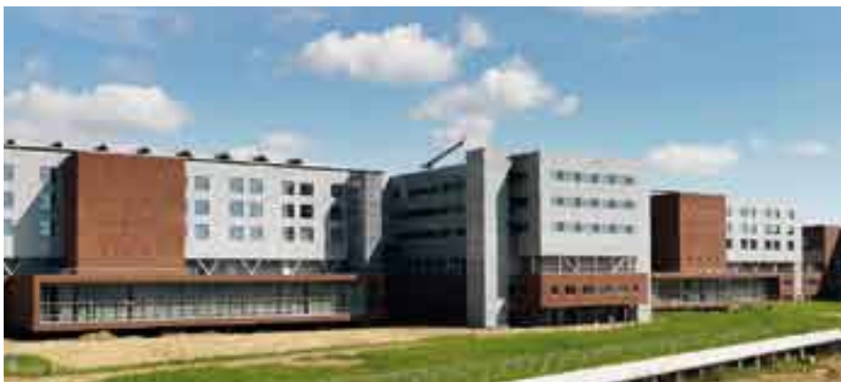
Strak, zakelijk, misschien wel kil, aan de buitenkant. Het interieur is echter zeer kleurrijk.

Het principe van persoonlijke beleving in een ziekenhuis doet misschien in deze tijd van een financiële crisis menig wenkbrauw fronsen. Ook acht jaar na het besluit is Orbis ervan overtuigd dat deze zogenaamde